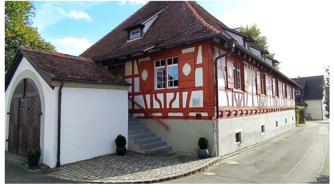
Jägerhaus mit Torkelscheuer

Von der Jägerstraße biegen wir wieder links in die Autenweilerstraße, zurück zum Rathaus bis zum Café Bar Firlefan. Von dort können wir den Kirchweg zur Kirche gehen, wo unser Pilgerweg endet. Alternativ kann man den Weg auch bei der Schule in Richtung Kirche gehen.